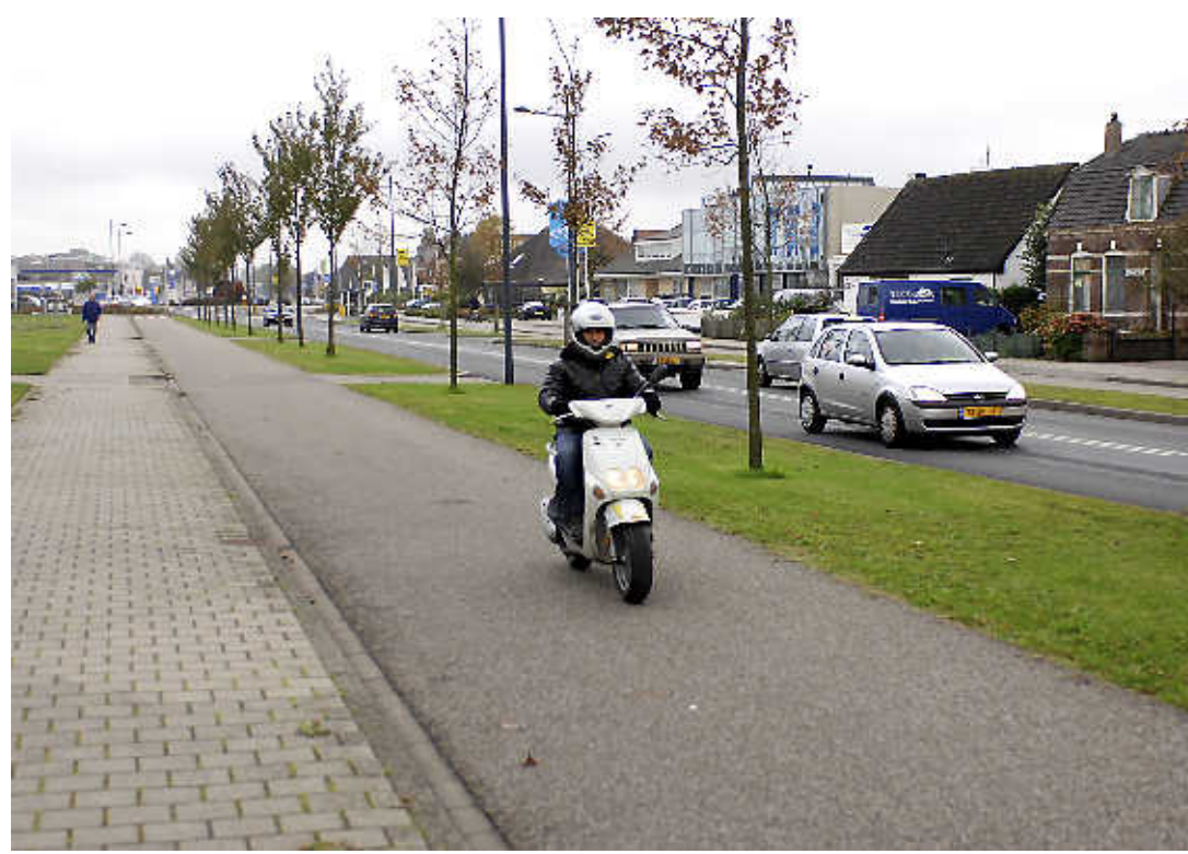
De bromfietser op het fietspad Rijksstraatweg moet straks naar de rijbaan.

De meeste gemeenten voerden die maatregel eind 1999 al in. Ook bijvoorbeeld Beverwijk. Uit onderzoek is gebleken dat de wijziging een gunstig effect heeft gehad op de veiligheid. Dat